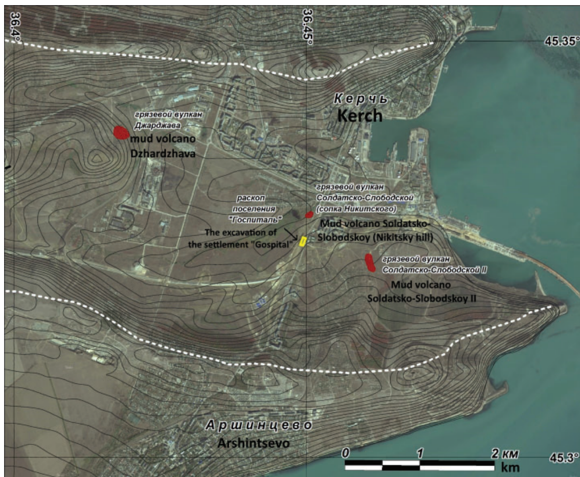
Рис. 9. Схема расположения поселения «Госпиталь» на основе космоснимка ( http://ecn.t0.tiles.virtualearth.net/tiles/a ). Белые линии – контуры подошвы мезотических известняков выраженных в рельефе грядой на крыльях Восходовской антиклинальной складки /

Fig. 9. Location of the hospital settlement “Hospital” on the basis of a satellite image ( http://ecn.t0.tiles.virtualearth.net/tiles/a ). White lines – contours of the base of Meotian limestones expressed in a relief by a ridge on the wings of the Voskhodovo anticlinal fold