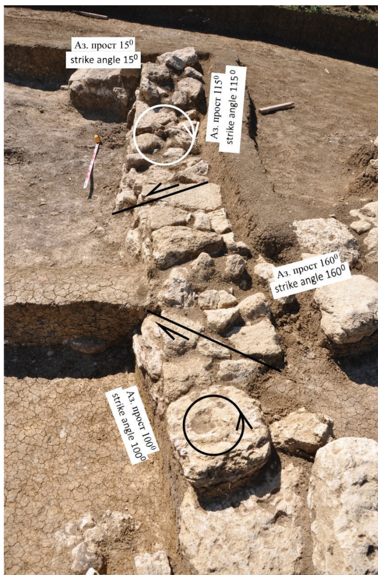
Рис. 7. Выбивание и развороты частей субширотной стены по сопряженным сколам в СЗ части строительного комплекса № 1. Фотография 26 мая 2017 г. /