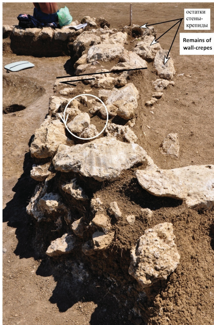
Рис. 6. Разворот против часовой стрелки западной части одной из стен в строительном комплексе 1. Восточная часть осталась на месте, в связи с её поддержкой стеной-контрфорсом. Фотография 26 мая 2017 г. /