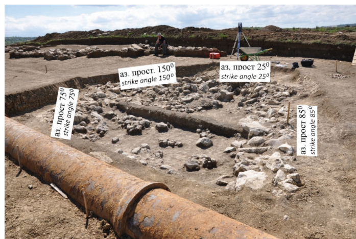
Рис. 4. Непрямоугольное положение стен в строительном комплексе 3: Острый угол между северной и западной стенами – 60°, тупой угол между западной и южной стенами – 125°. Южная стена изломана и повернута против часовой стрелки на 75°, по-видимому, в связи с сильным течением грунта в восточной части комплекса. Фотография 26 мая 2017 г. Вид на запад /