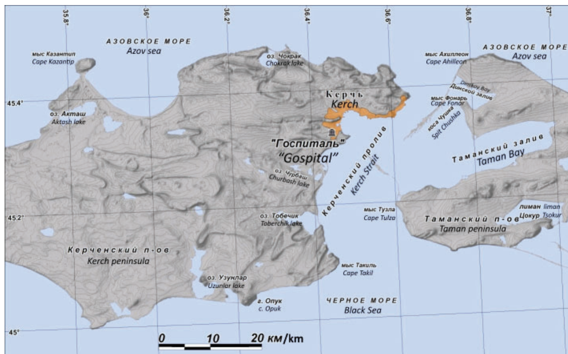
Рис. 1. Схема расположения поселения «Госпиталь» на восточном окончании Керченского полуострова /