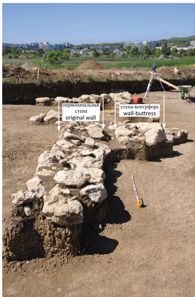
Рис. 8. Остатки стен строительного комплекса № 2. Первичная западная стена наклонилась на восток и для её укрепления была пристроена крепида с восточной же стороны.