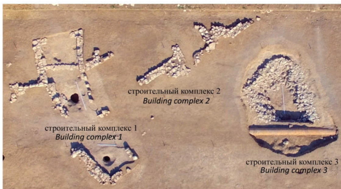
Рис. 2. Общий план городища «Нижний госпиталь». Снимок ориентирован на запад (из Отчета археологических раскопок памятника «Поселение Госпиталь-1»)

Другой пример деформаций, возникающих при воздействии сейсмических колебаний перпендикулярно простирацию вытянутых стен – это их выгибания в плане. Подобные строительные повреждения возникают при относительной свободе