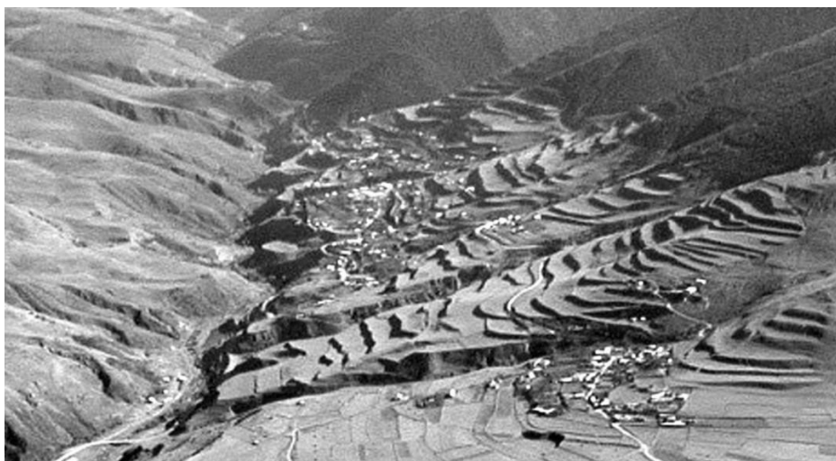
Рис. 3. Озерные террасы в Чмийской котловине (фото Р. Тавасиева) /

Террасированные склоны с разной степенью сохранности можно наблюдать во всех котловинах на абсолютных высотах 1350–1500 м (рис. 3).